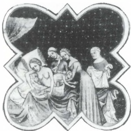
Jean Bondol: "Από την ιστορία της καισαρικής τομής". (Spikestad Coll. Martin Schøgen, vol. 2, f 199, part).

νή εξέλιξη του τοκετού και τις επιπτώσεις του πάνω στη μητέρα και στο παιδί. Αν όλα πάνε καλά, η γυναίκα έχει απόλυτη ελευθερία κινήσεων.