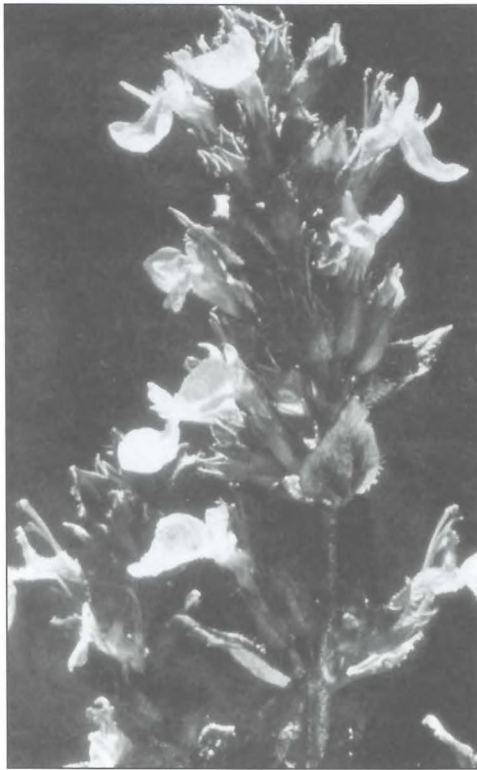
Εικόνα 6. “Της Παναγιάς το χορτάρι”.

Σύμφωνα με τη λαϊκή αντίληψη, ο θηλασμός είναι ισοδύναμος με τον τοκετό για την επιβεβαίωση της μητρότητας: