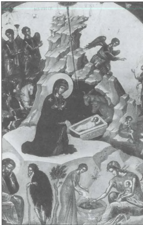
Εικόνα 4. Βυζαντινή εικόνα της Γέννησης. Εικονίζεται το παραδοσιακό σπαργάνωμα. Κάτω δεξιά, η μαία επιμελείται το πρώτο λουτρό του νεογέννητου.

αποτελεί ο ειδικός κεφαλόδεσμος-σκουφάκι, που χρησιμοποιείται στις βαπτίσεις κατά την ένδυση του παιδιού.