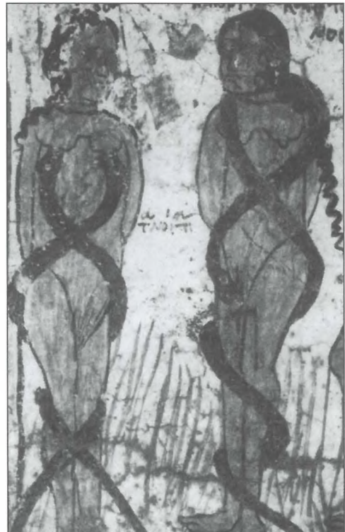
Εικόνα 5. "Η μη θηλάζουσα τα νήπια". Βυζαντινή εικονογράφηση σε εκκλησία της Κρήτης.

Στη λαϊκή μας παράδοση, το μητρικό γάλα είναι τόσο ιερό όσο και η Θεία Μετάληψη. Δεν πρέπει να πέσει κάτω και, αν πέσει, να μην πατηθεί. Πολυάριθμες εκκλησίες του ελληνικού χώρου, από τα Ιόνια νησιά ως την Κύπρο και από τον Πόντο ως την Κρήτη, είναι αφιερωμένες στη Θεοτόκο, με επιθετικό προσδιορισμό σχετικό με τη γαλουχία. "Γαλακτοφορούσα",