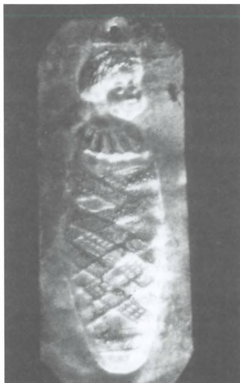
Εικόνες 2α και 2β. Εικοσιπέντε αιώνες χωρίζουν τα δύο αφιερώματα. Αριστερά, πήλινο που βρέθηκε στο Ασκληπιείο της Κω και δεξιά, μεταλλικό των αρχών του αιώνα.